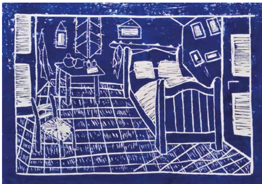
Práce žáků 8. B – linoryty podle Vincenta van Gogha.